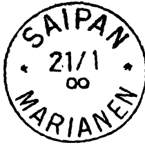
Kleine Nullen (abgeschnittene Neunen) von Januar 1900 bis 22. August 1900