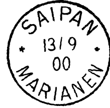
Große Nullen vom 22. August 1900 bis 31. Dezember 1900